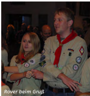
Rover beim Gruß

Roverinnen und Rover treffen Entscheidungen für ihre Zukunft. Sie packen an und entdecken die Welt mit ihren Menschen und Kulturen.