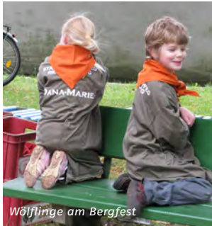
Wölflinge am Bergfest

Die Kinder sind zwischen 7 und 10 Jahre alt.