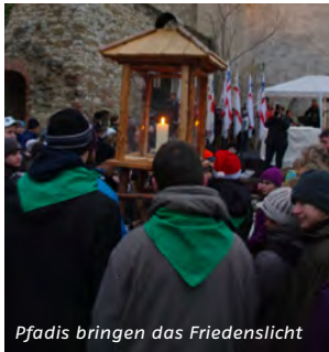
Pfadis bringen das Friedenslicht

Sie brechen aus ihrem Alltag aus, stecken sich Ziele und versuchen, sie zu erreichen.